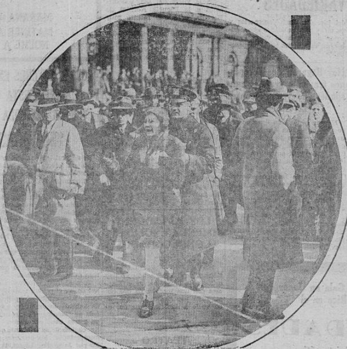
La policía neoyorquina disolviendo una reciente manifestación comunista frente al City Hall, la era verificada en pocos meses