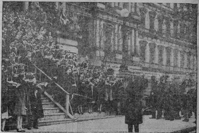
La orquesta de la National High School de Nueva York, que cuenta con ciento cincuenta músicos, aparece aquí dando una serenata al presidente Hoover, en Washington, pudiendo verse al festejado en el extremo derecho de la foto